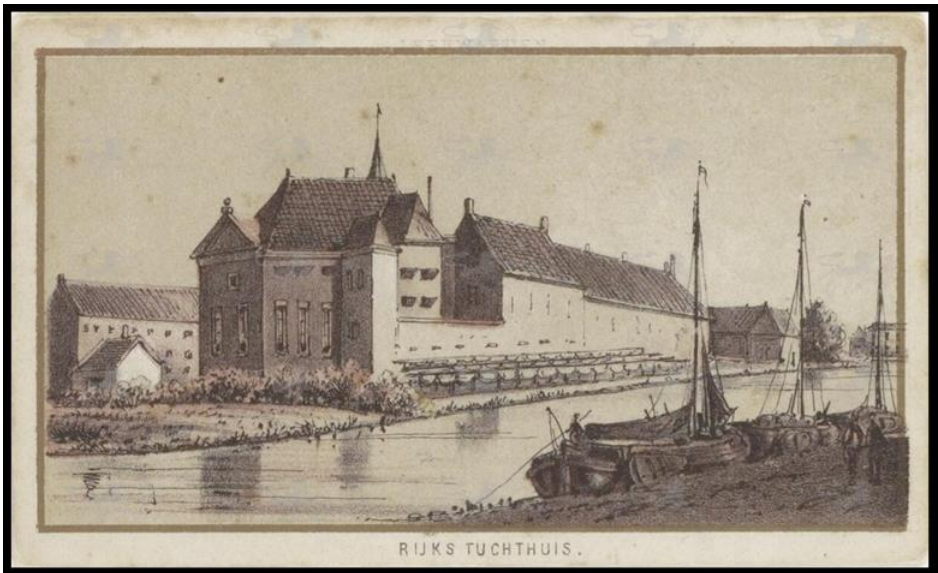
It Tuchthûs yn Ljouwert

As't Hiltsje hast de helte fan har straf hân hat komt der in ein oan har libben; op 13 febrewaris 1820 stjit yn de akte. Hy hja langstme nei de bern en famylje? Wie hja siik? Wie hja ûnwennich? Wy sille it nea witte, mar tryst is it fansels wol.